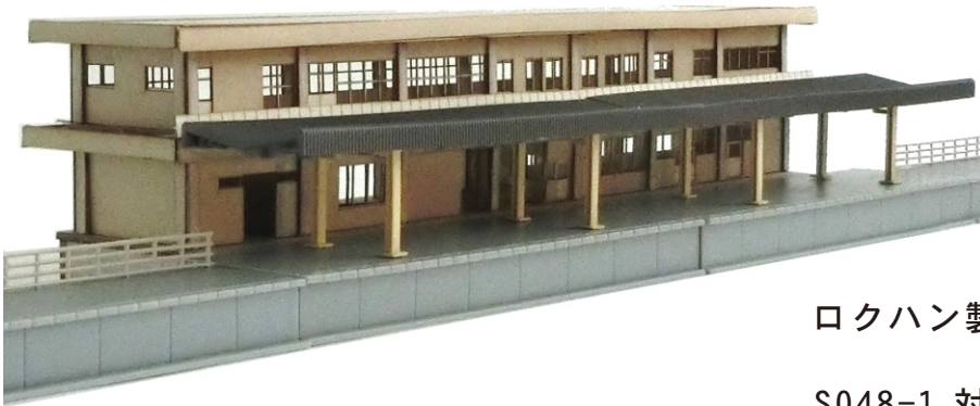
ロクハン製ホームとの組合せ例

S048-1 対向式ホームセット×1 S046-2 島式ホーム延長セット×2 との組合せです。